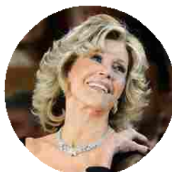
Bellezza senza età