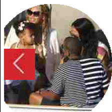
Buon compleanno, Beyoncé