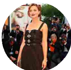
Venezia: i voti ai look