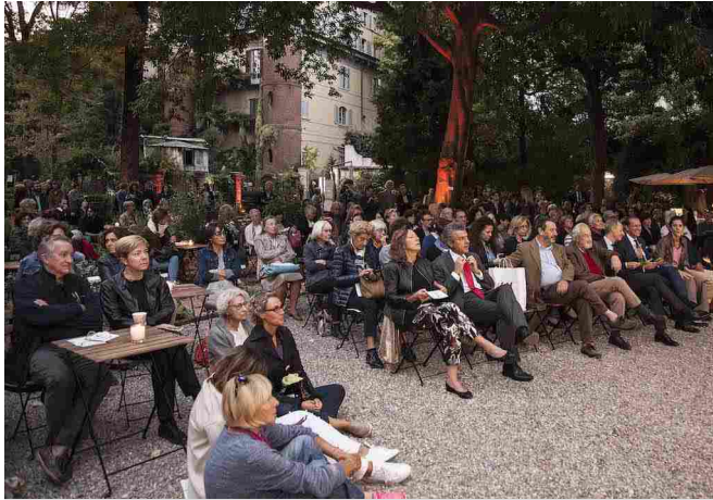
Il festival milanese si è aperto nella splendida cornice dell'orto botanico di Brera

folla che si è radunata nell'orto botanico di Brera alcuni brani dello scrittore Italo Calvino dedicati al mondo vegetale, tratti da "Palomar", "Il barone rampante" e "Le città invisibili".